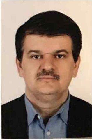
دکتر بیژن فروغ